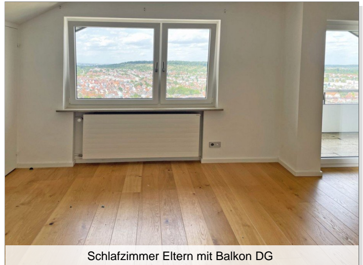
Schlafzimmer Eltern mit Balkon DG