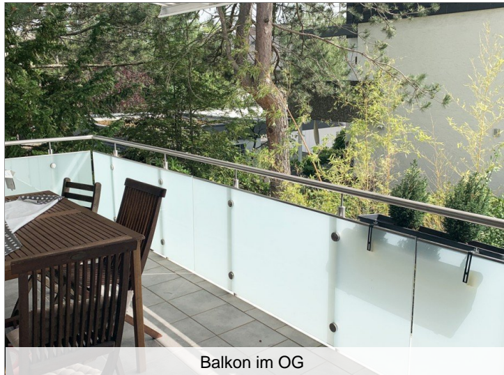
Balkon im OG