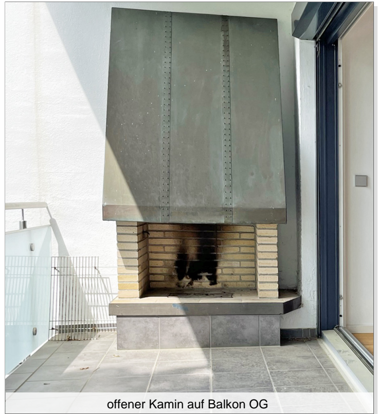
offener Kamin auf Balkon OG