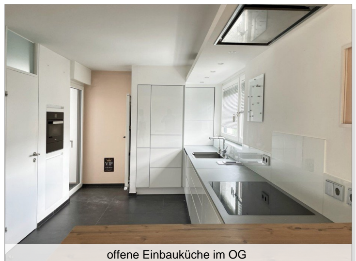
offene Einbauküche im OG