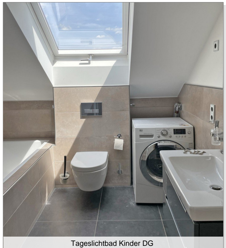
Tageslichtbad Kinder DG