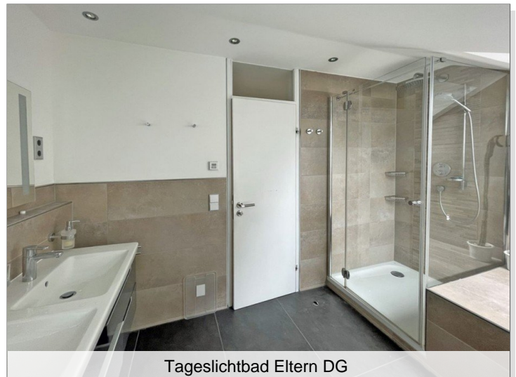
Tageslichtbad Eltern DG