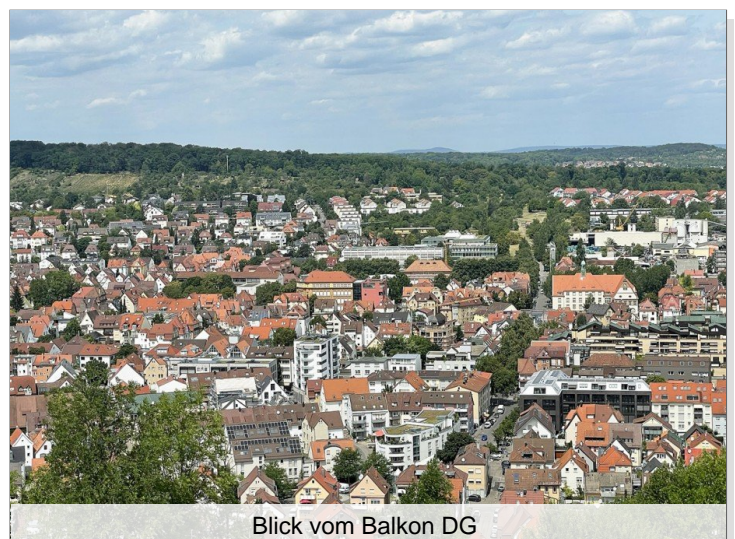
Blick vom Balkon DG