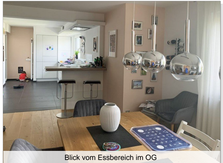
Blick vom Essbereich im OG