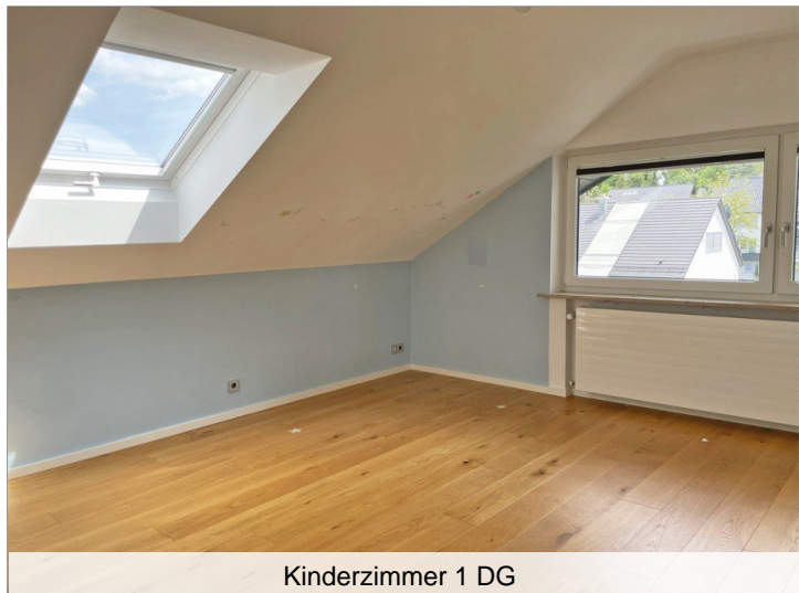
Kinderzimmer 1 DG