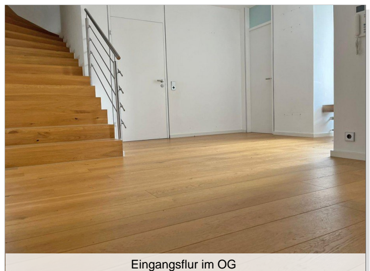
Eingangsfur im OG