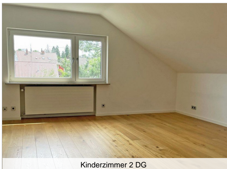
Kinderzimmer 2 DG