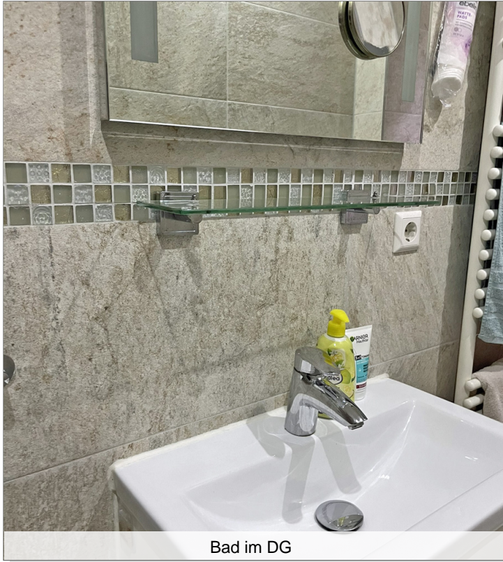
Bad im DG