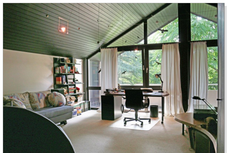
Zimmer OG (exemplarisch)