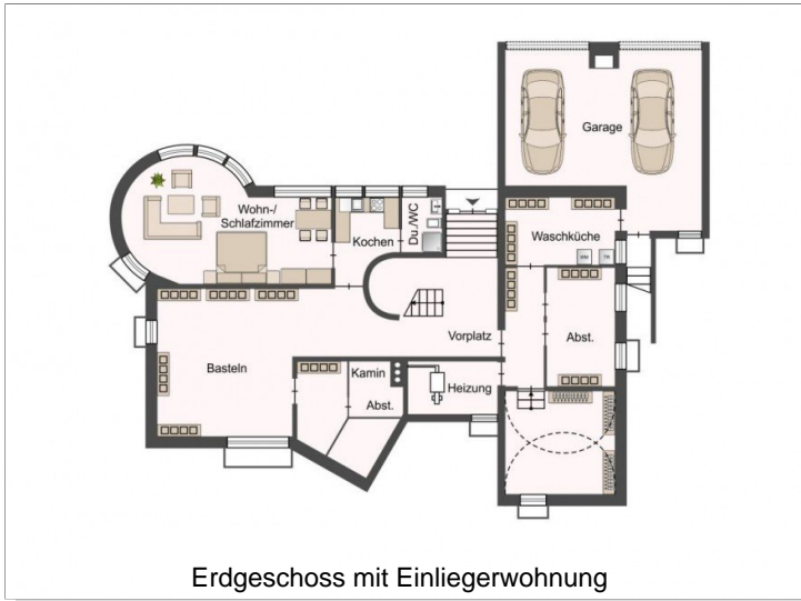
Erdgeschoss mit Einliegerwohnung