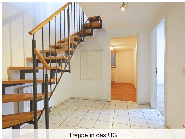
Treppe in das UG