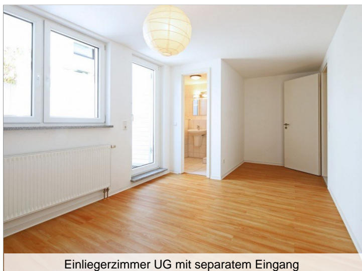
Einliegerzimmer UG mit separatem Eingang