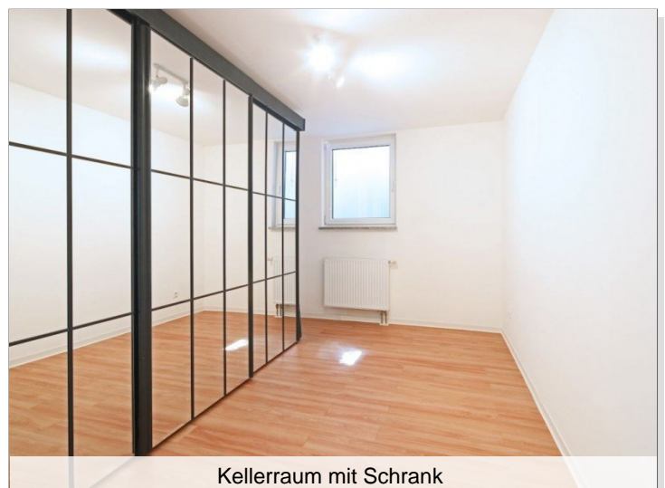
Kellerraum mit Schrank