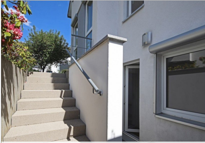
Eingang Einliegerbereich UG