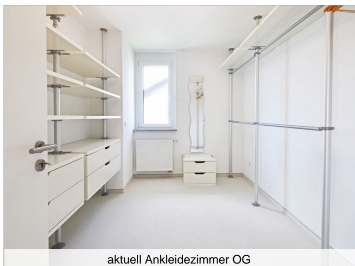
aktuell Ankleidezimmer OG