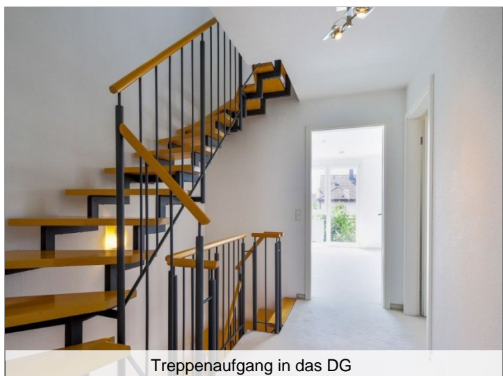
Treppenaufgang in das DG