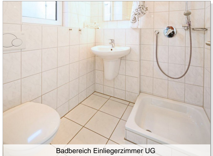
Badbereich Einliegerzimmer UG