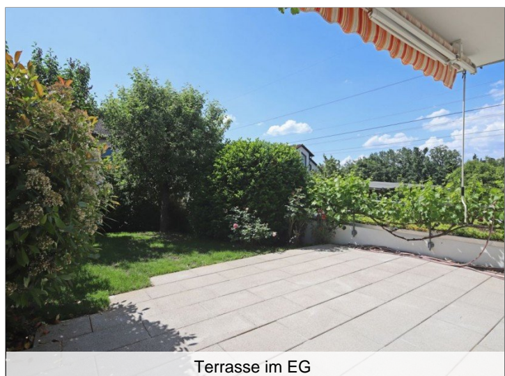
Terrasse im EG