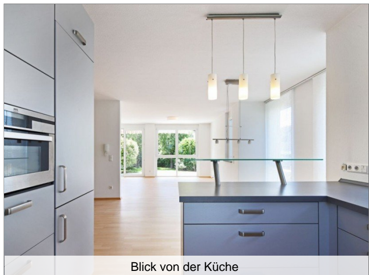
Blick von der Küche