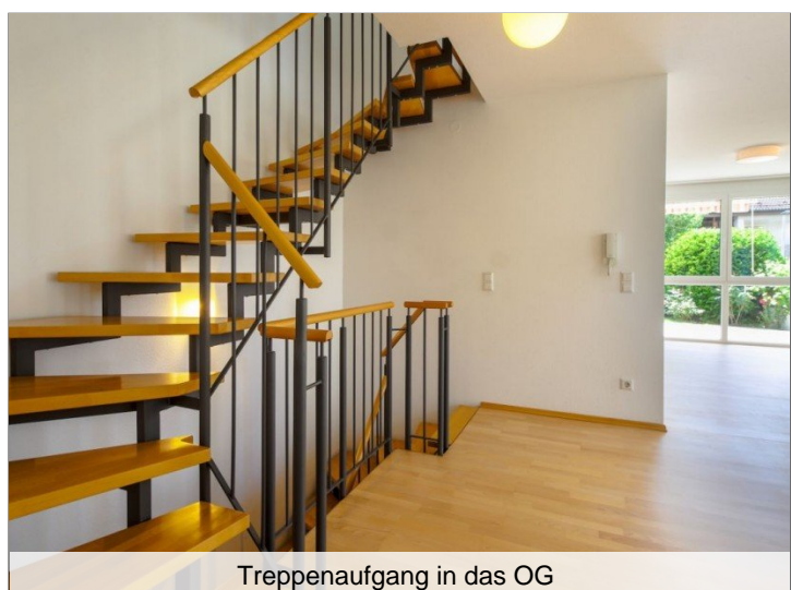
Treppenaufgang in das OG