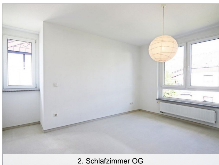
2. Schlafzimmer OG