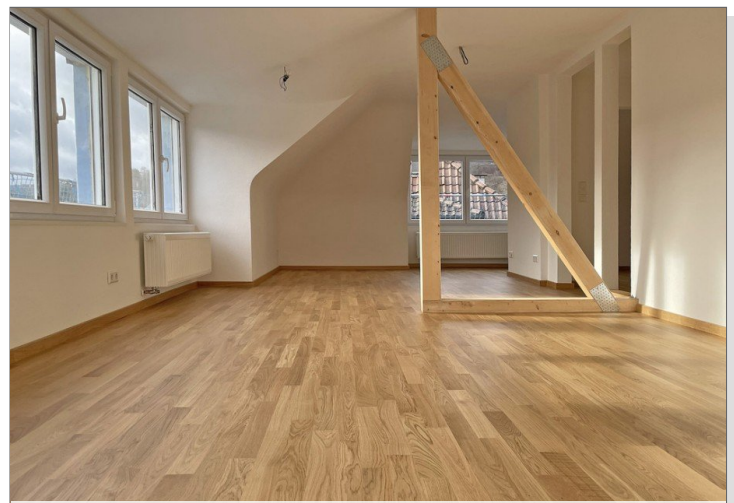
Wohn- und Essbereich1