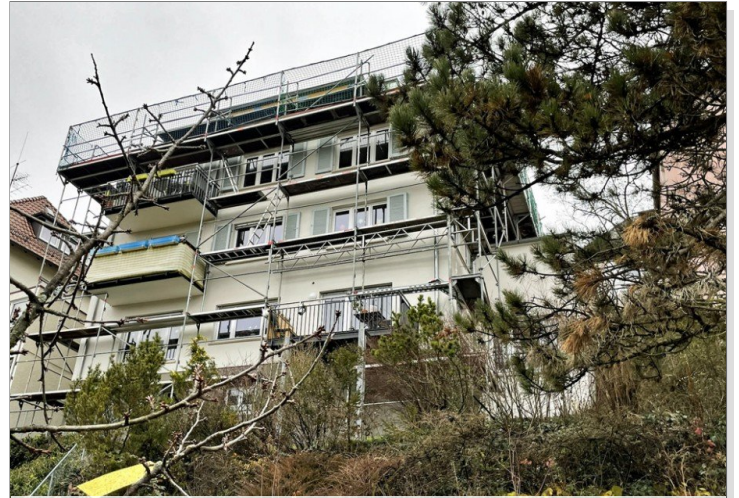
Blick vom Garten in das (noch) eingerüstete Haus