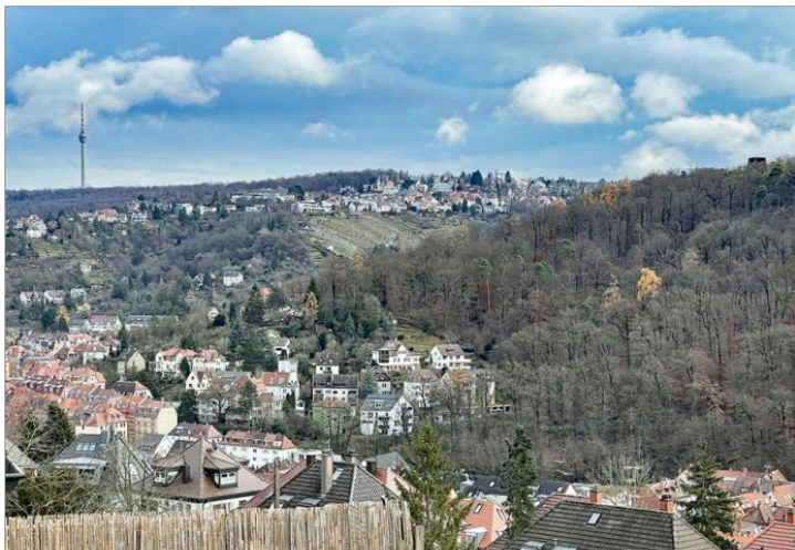
Blick aus dem Küchenfenster