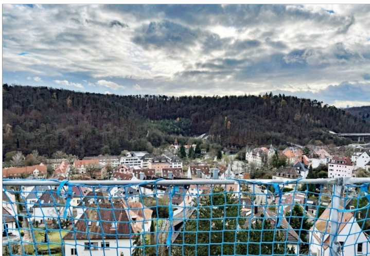
Blick aus dem Wohnbereich (noch mit Gerüst)