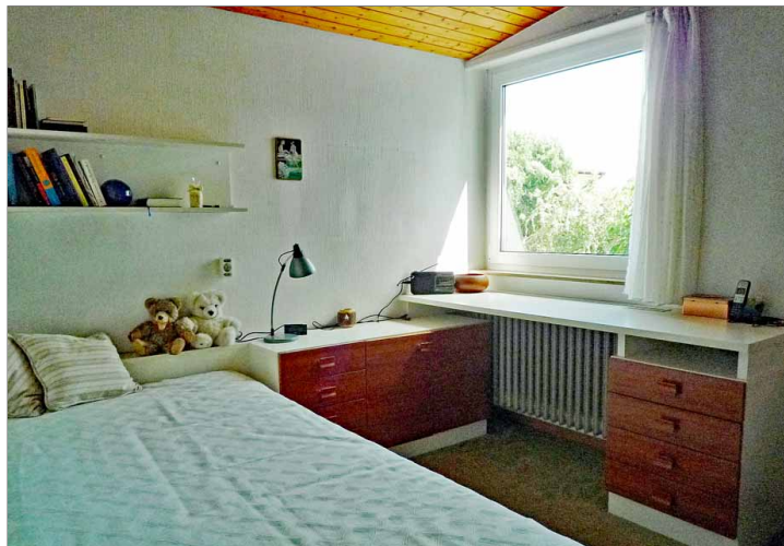
DG - Kinder-bzw. Arbeitszimmer 1