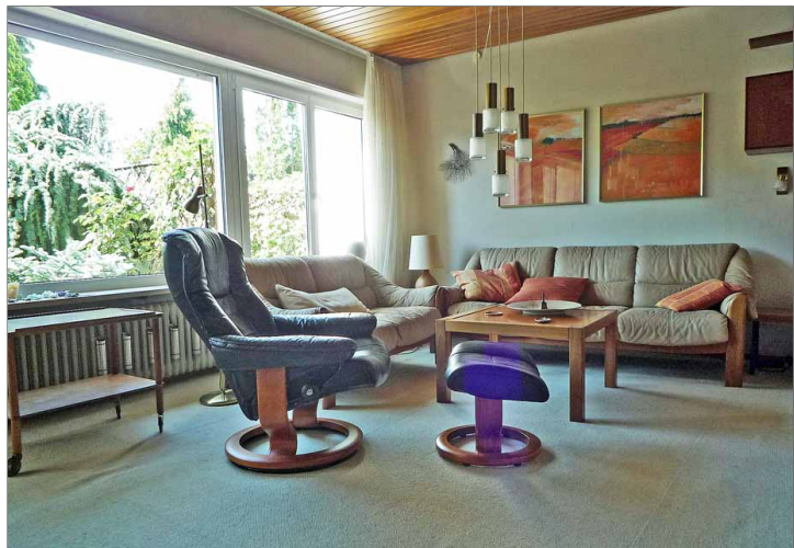
EG - Wohnbereich