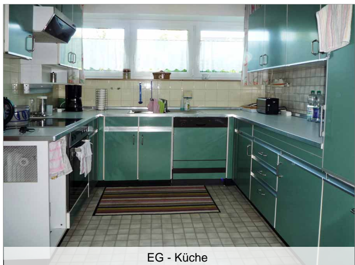
EG - Küche