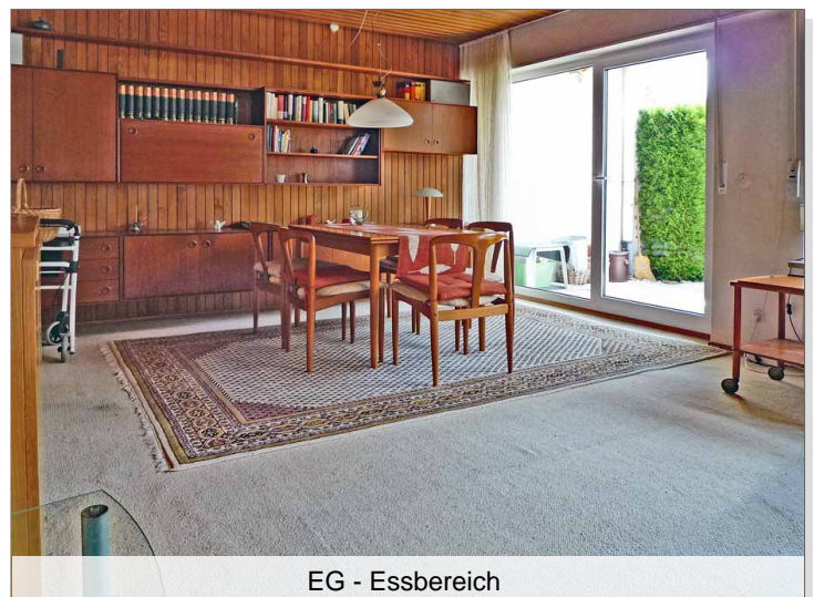
EG - Essbereich