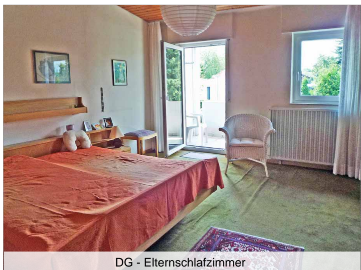
DG - Elternschlafzimmer