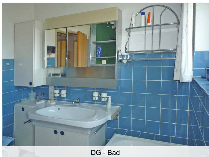
DG - Bad