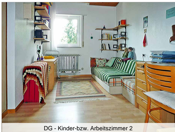
DG - Kinder-bzw. Arbeitszimmer 2