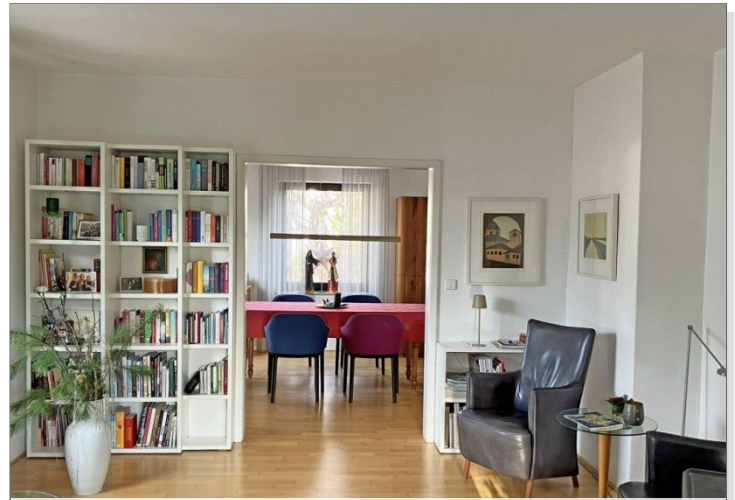
Blick vom Wohn- in den Essbereich EG und OG