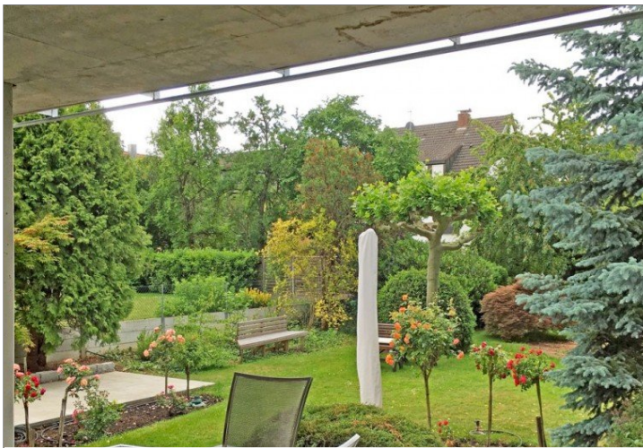
Blick von der überdachten Terrasse in den Garten