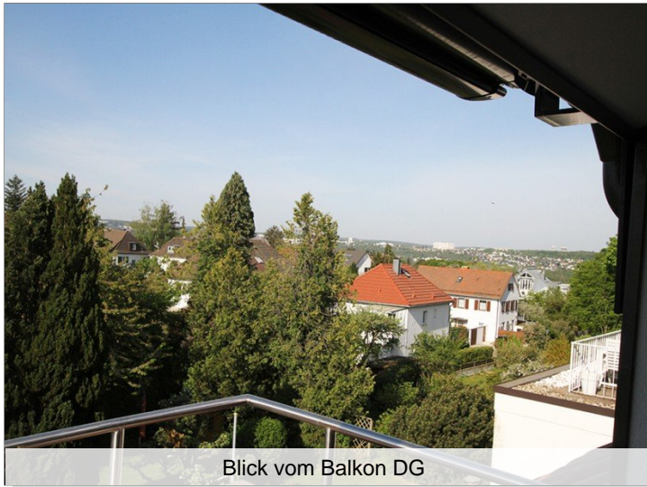
Blick vom Balkon DG