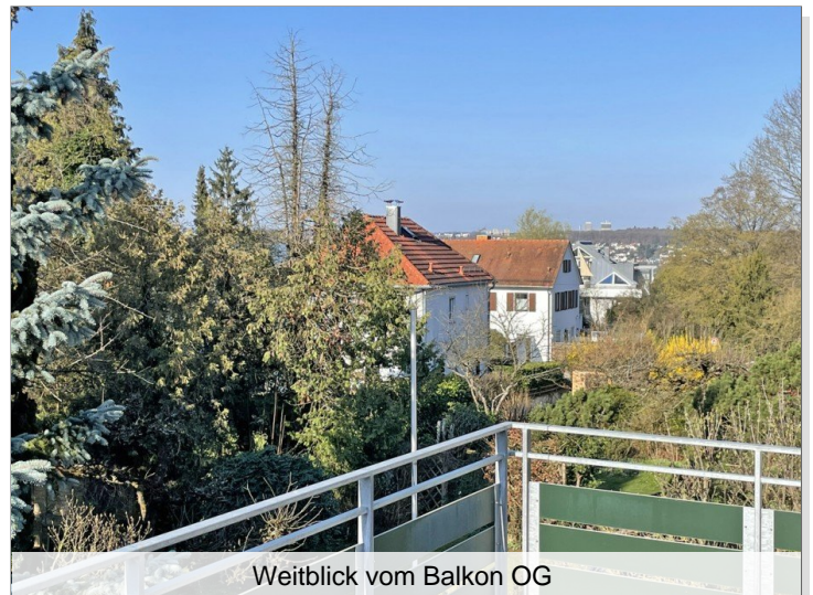
Weitblick vom Balkon OG