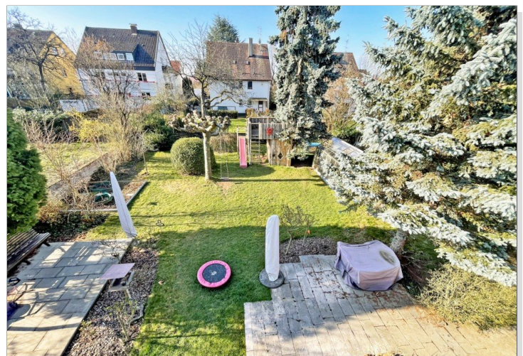
Blick vom Balkon in den Garten OG