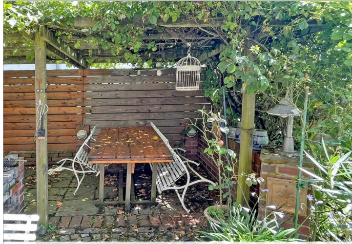
Blick in die Gartenlaube