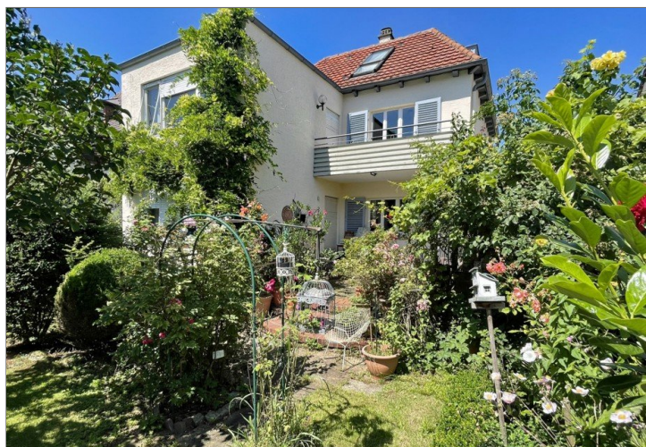
Hausansicht vom Garten