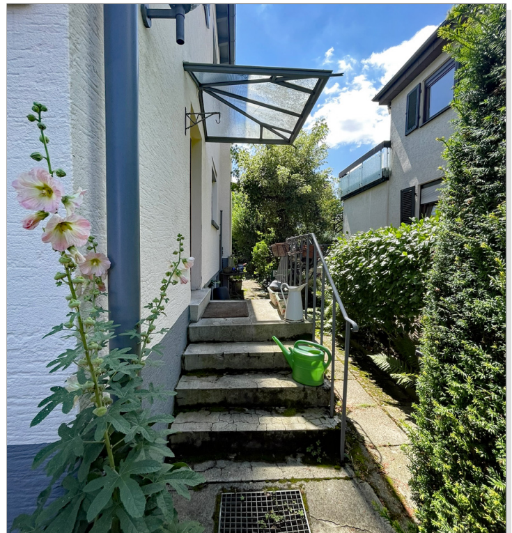
Gartenweg zum Eingang